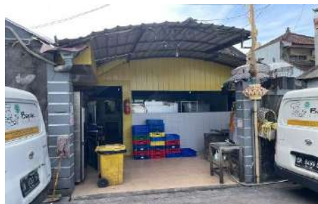
Gambar 3. Pabrik PT. Bapak Bakery