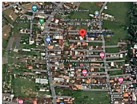
Gambar 2. Lokasi PT. Bapak Bakery

Berisi uraian tentang lokasi perusahaan termasuk peta lokasi dan tata letak perusahaan. Lokasi perusahaan juga disajikan dalam bentuk gambar dan dibuat ditengah-tengah. Contoh dapat dilihat pada Gambar 1, dan Gambar 2. Tata letak ( layout ) dapat dilihat disajikan langsung di dalam naskah atau disajikan pada Lampiran.