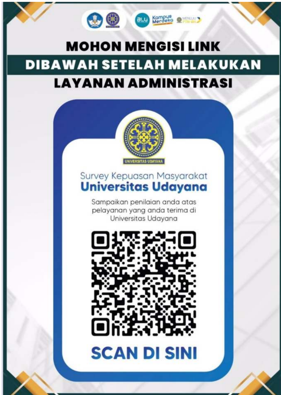
QR Code SKM Unud 2024